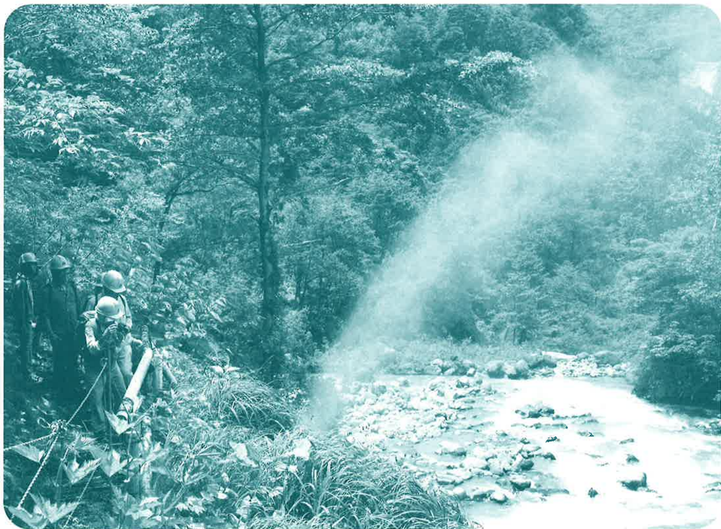
噴泉（文化遺産巡りコースで見学）