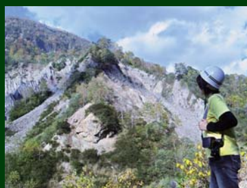
21年度応募作品より