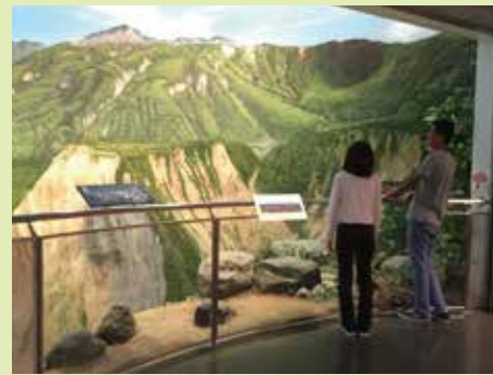
立山カルデラ 大型地形ジオラマ 直径12m、1～3階 まで吹き抜けのド ーム型ジオラマで、六九 谷展望台から見た風 景を再現しています。