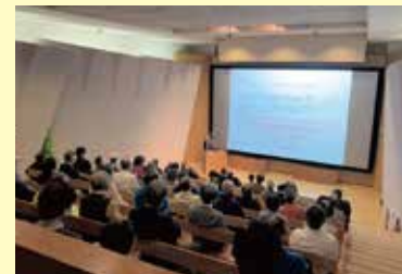
大型映像ホール 立山カルデラを大型映像でご覧ください。 (約20分) ●「崩れ」 ●「立山カルデラ 大地のドラマ」 ●「タイムトラベル常願寺川」 ※上映時刻は博物館へお問い合わせください。