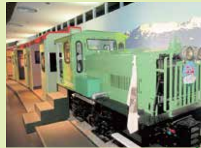
トロッコ列車 実車展示 立山砂防のシンボルともいえるトロッコ列車。 各車両ごとに立山砂防の歴史を紹介。