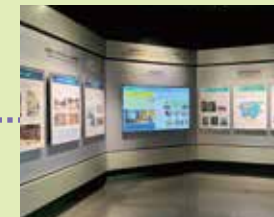
富山平野の暮らしを支える ～砂防(SABO)

体験学習会やフィールドワ ッチングで現地見学します。 ●立山カルデラ地域 ●立山地域 ●称名地域 ●有峰地域 ●立山山麓地域 ●常願寺川扇状地