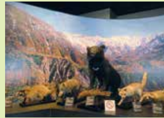
立山カルデラの生き物たち