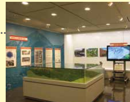
企画展示室 企画展、特別展、写真展等を開催。