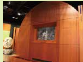
安政の大災害シアター 1858(安政5)年に起こった大災害を 紙芝居とアニメーションで再現します。