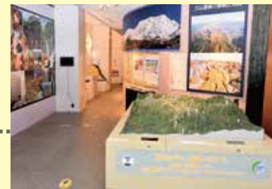
立山の自然コーナー 学芸員の視点から、立山の観察ポイントを紹介。

当館ホームページまたは応募ハガキ(普通ハガキ可)で 事前にお申し込みください。 ※詳しくはホームページ、または「応募のてびき」をご覧ください。 (当館、県内市町村窓口、県民会館、CiC等で配布)