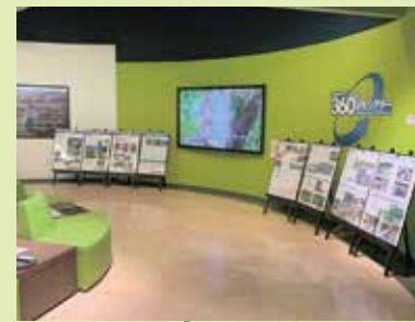
立山カルデラ 360°VRシアター 立山黒部アルペン ルートと立山カル デラを天空から全 方位眺めることが できます。