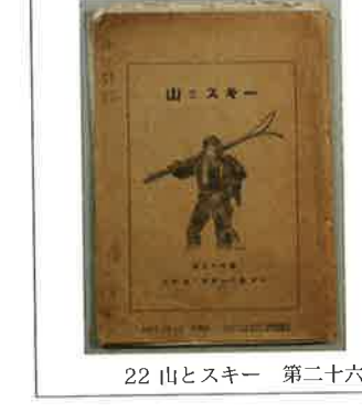
22 山とスキー 第二十六號