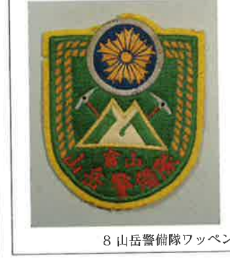
8 山岳警備隊ワッペン