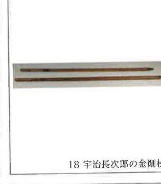
18 宇治長次郎の金剛杖