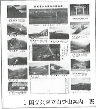
1 国立公園立山登山案内 裏