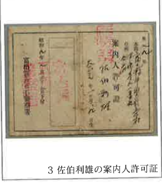
3 佐伯利雄の案内人許可証