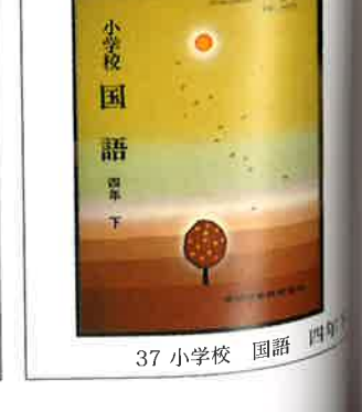
37 小学校 国語 四年下