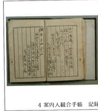
4 案内人組合手帳 記録