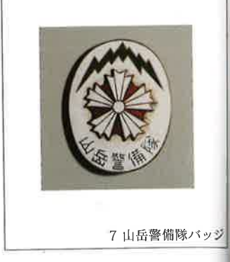
7 山岳警備隊バッジ