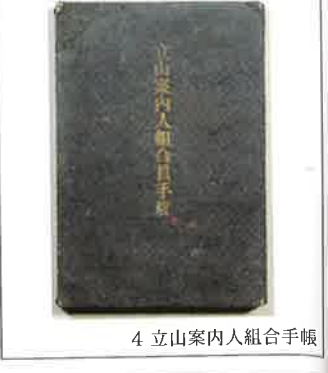
4 立山案内人組合手帳