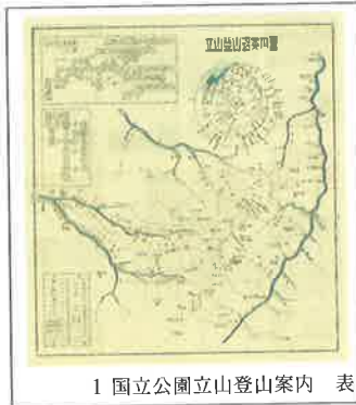
1 国立公園立山登山案内 表