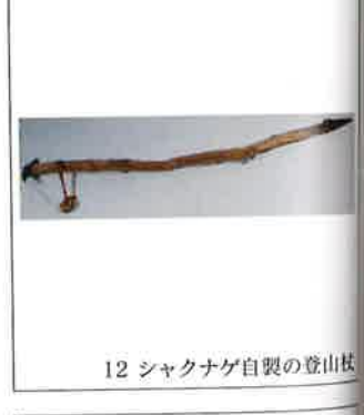
12 シャクナゲ自製の登山杖