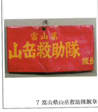
7 富山県山岳救助隊腕章