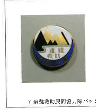
7 遭難救助民間協力隊バッジ