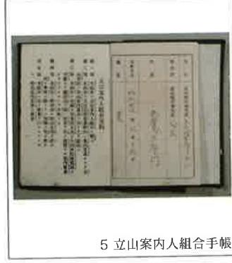
5 立山案内人組合手帳